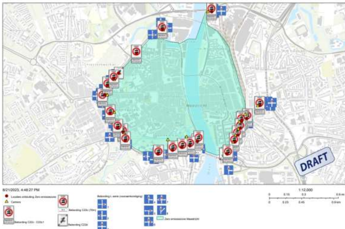
Overzichtsk kaart bebording

In bijgevoegd ontwerp-verkeersbesluit is een onderbouwing van nut en noodzaak van de zone opgenomen met de precieze afbakening van de zone en de locaties van de borden (zie afbeelding).